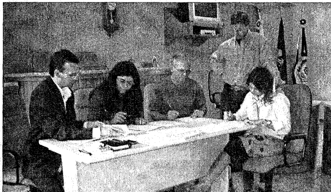
Apenas dois empresários entregaram propostas